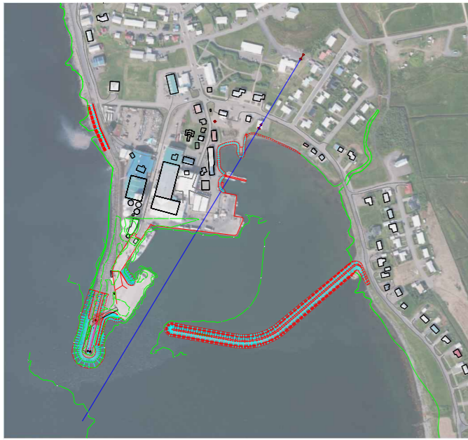
Yfirlitsmynd Mkv. 1:10.000